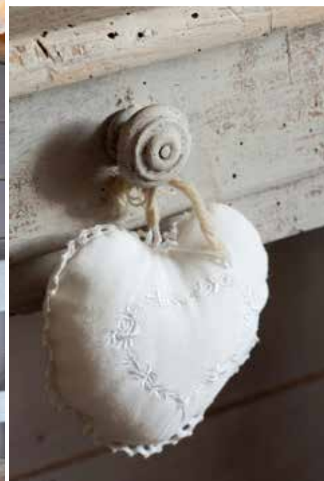
Le détail a été soigné tant pour la déco que le mobilier ou encore le fonctionnel.