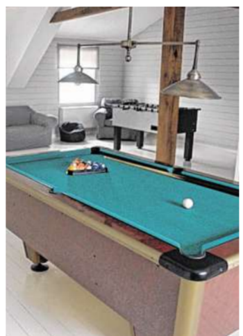
Bei schlechtem Wetter kann sich der Nachwuchs im Playroom austoben.

Im Sommer lässt ein Grillfest (Grill gehört zur Ausstattung) mit Aussicht auf die pure Natur ringsum nicht lange auf sich warten und das köstliche Fleisch dazu gibt es in den Ardennen wie kaum anderswo. Noch am Anknüpfungstag wird die Versorgungslage sondiert. Einkaufen kann man in rund 20 bis 30 Minuten Fahrzeit in den modernen Einkaufszentren in Libramont und Neufchâteau. Aber auch im Ort Paliseul selbst. Duftschwaden nach Räucherwaren über dem kleinen Marktlocken in die Metzgereien. Dort gibt es Regi-