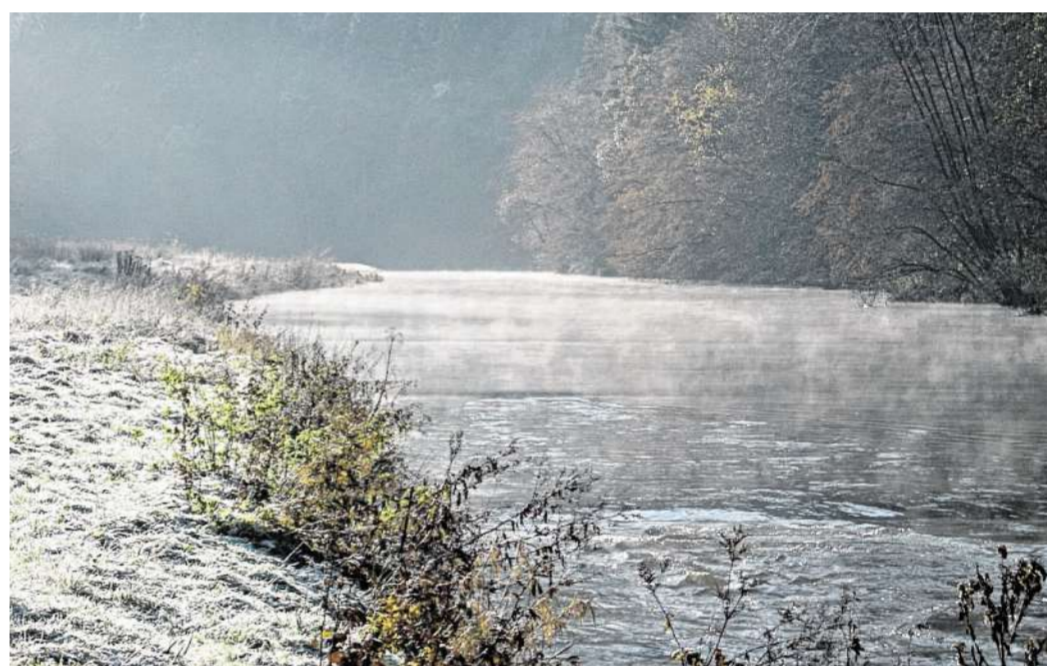
Die Ardennen haben zu jeder Jahreszeit ihren Reiz.

Nach soviel Aktivitäten, vollgetankt mit gesunder Ardennenluft, gibt es nur noch eins: Entspannung im Ferienhaus, Holzsauna auf den Kamin, den Jacuzzi aufsprudeln oder ins warme Wasser des Pools, er hat rund um die Uhr 28 Grad Celsius.