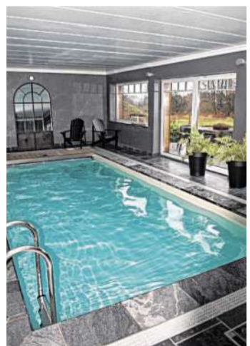
Ein Pool gehört zu so manchem Ferienhaus.